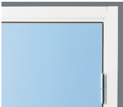
Skyddande kant runt om hela dörrbladet som både skyddar och gör det lätt att hålla rent.