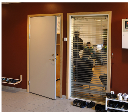
Ljuddörr 40dB används oftast i sammanträdesrum